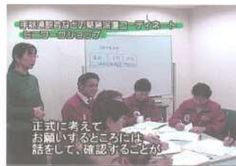
「目で聴くテレビ」2005年12月7日の訓練生中継より